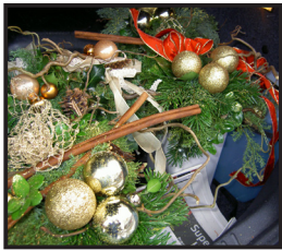
Billeder af juledekorationerne

Brystkræft Screeningen i Randers fik ligeledes i år to juledekorationer. Endelig har vi også besøgt Hospice Søholm med juledekoration og påskeblomster samt en fælles-gave bestående af 4 kivi fyrfadsstager.